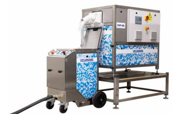
Droogijsstraalmachine kan meteen gevuld worden met droogijs