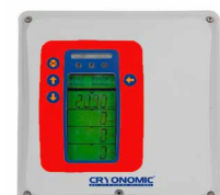
CO 2 detector