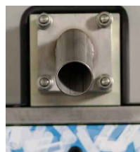
Snelle matrijswissel met 4 bouten