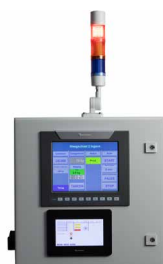
Pelletiser-, weegschaal- en CO 2 detector kan bediend worden met een afstandsbediening