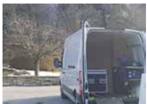
Abmessungen der Box: 120 x 60 x 80 cm

Den Koffer wird verwendet, um vollständig an den Ort der Reinigungsaufgabe zu kommen und für professionelle Demonstrationen. Enthält eine komplette Palette an professionellen Schutzausrüstungen für die Trockeneisreinigung.